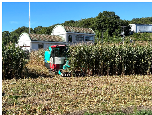
収穫作業 (青刈り WCS、7/22)