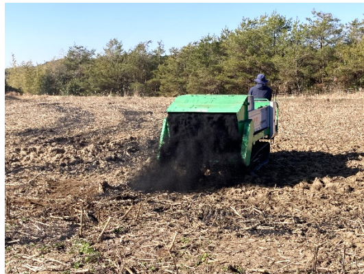
もみ殻炭表面散布 (2024/2/18)