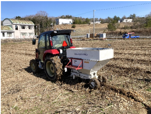
もみ殻炭暗渠施用 (2024/2/9)