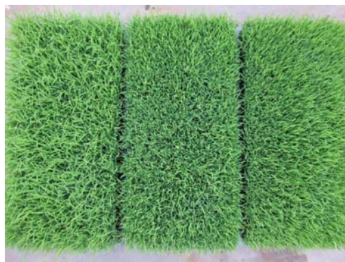
写真1 播種状況 (左 150g、中 250g、右 300g) 写真2 苗の状況 (左 150g、中 250g、右 300g)