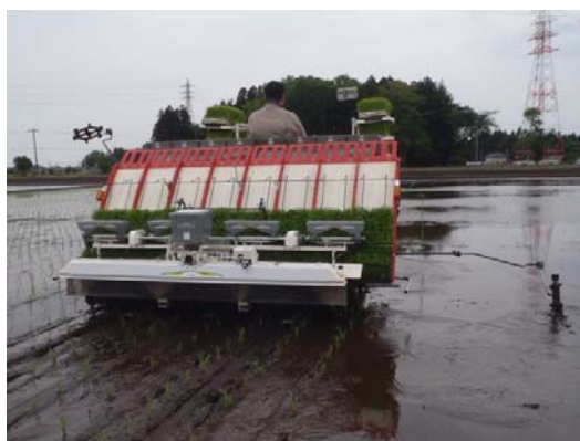
写真3 苗の状況 (左 150g、中 250g、右 300g) 写真4 移植時の状況