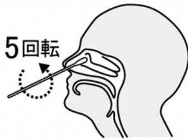
鼻腔ぬぐい液採取